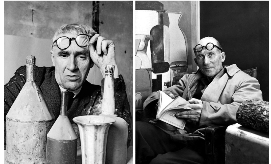
Imagen de la primera página: Giorgio Morandi y Le Corbusier, fotografiados en sus respectivos estudios.

(2): Morandi miraba, de manera intermitente, primero hacia las botellas, después hacia el lienzo. Cuando hacía esto, tenía que levantar sus gafas también de manera intermitente. Necesitaba las gafas para ver con claridad las pinceladas que daba sobre la tela, pero no las necesitaba para ver los objetos. Prefería ver los modelos de una manera más bien borrosa. Pero el hecho de tener que levantar sus gafas, solía terminar por producirle cierto escozor en las orejas. Así que, un día, decidió ponerse un poco de algodón en la parte superior de las mismas. El invento funcionó y no dejó de hacer esto hasta el final de sus días.